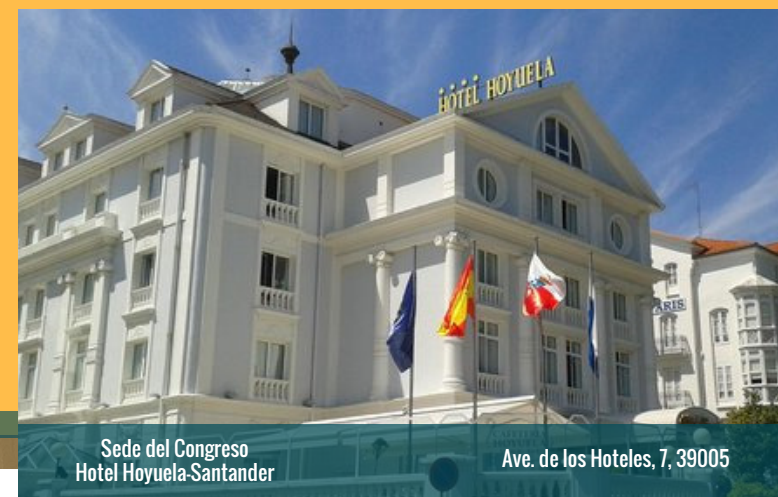
Sede del Congreso Hotel Hoyuela-Santander

Enviar justificante de pago a 44symposium@septg.es